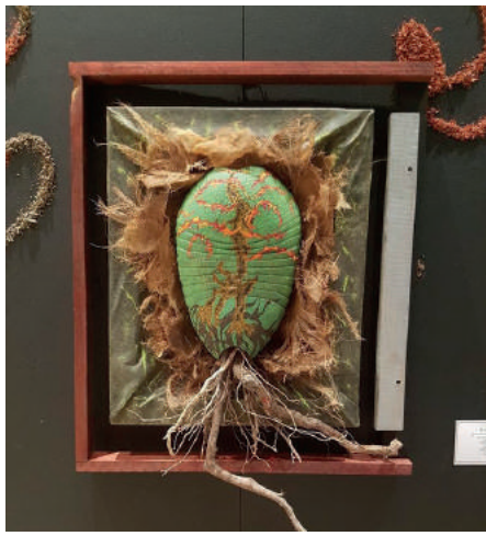
Caparazón de armadillo tallado y pintura de óleo. | 85x62x35 cm

Árbol en forma de ave que mimetiza una de sus alas con la Tierra y las raíces de su ser.