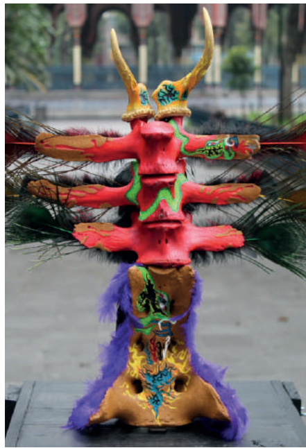
Tallado de cuernos de venado, columna vertebral y pelvis de vaca, óleo, plumas. 55x67x67 cm | Bestiario.

Los colores: verde, azul, amarillo, naranja, rosa, violeta, azul y blanco dicen –al igual que en el Pez Diablo– las tonalidades y forma del conocimiento, que está en lo que algunos llaman el otro.