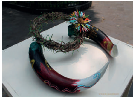
Tallado de cuernos de toro, flor, óleo, corona de espinas. | 30x40x40 cm

La sabiduría de Jesucristo coronada por el hombre donde las espinas han logrado la Flor y el Canto (poético) multiexpresivo de la humanidad