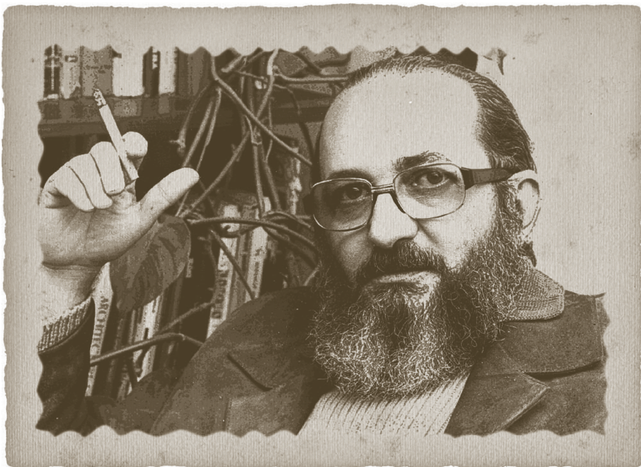
▪ Paulo Freire, Brasil 1921 - 1997 | Desarrolló un método educativo desde la problemática social, invitando al estudiante a construir sociedad a través de la asimilación de los problemas cotidianos.