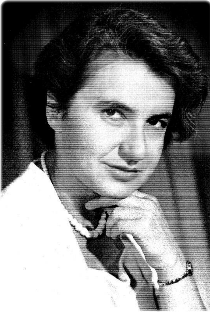
▪ Rosalind Franklin , Inglaterra 1920 - 1958 | Biofísica y cristalógrafa destacada por su participación crucial en la comprensión de la estructura del ADN, ámbito en el que dejó grandes contribuciones.