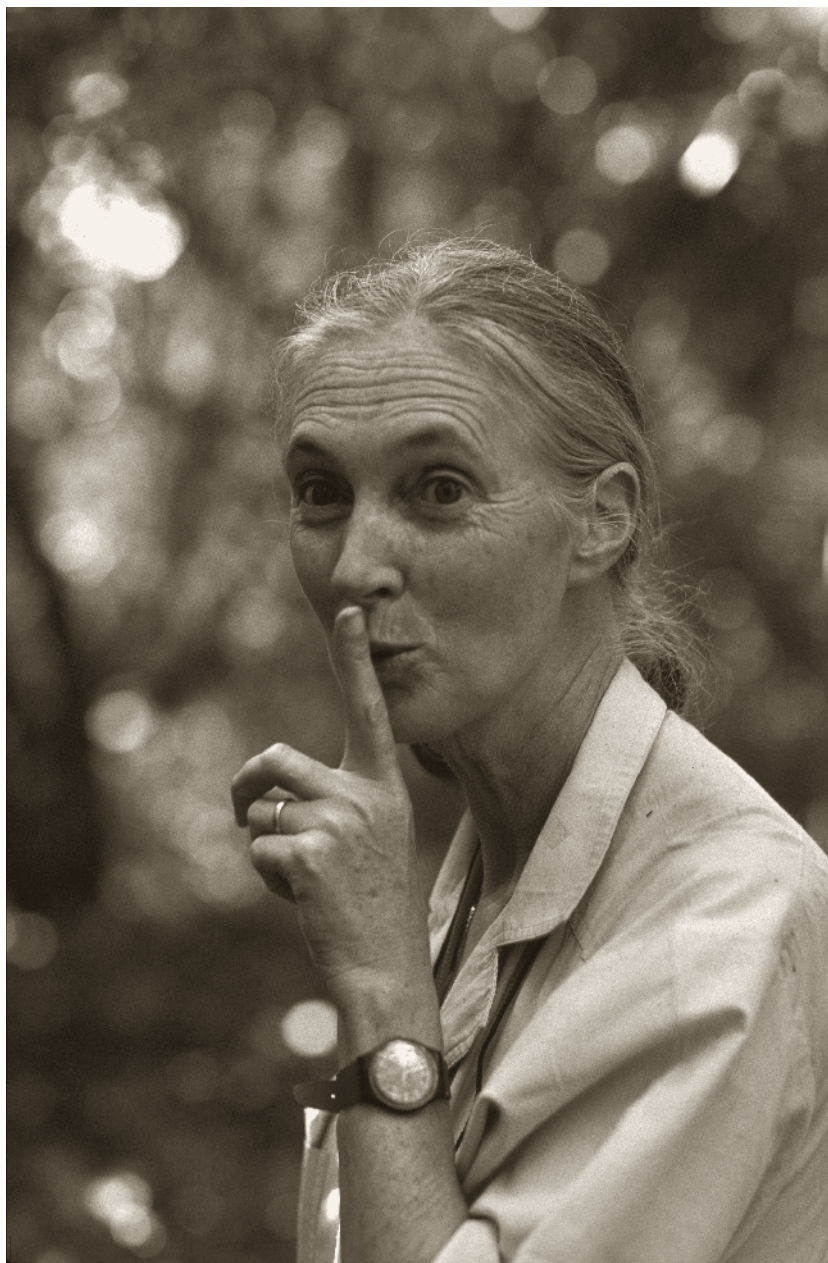
■ Jane Godall, Inglaterra 1934 | Primatóloga, ha realizado profundas y fructíferas investigaciones científicas sobre el comportamiento, el uso de herramientas y los modos de vida de los chimpancés.